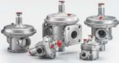
TEK KADEMELİ GAZ BASINÇ REGÜLATÖRLERİ