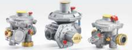
ÇİFT KADEMELİ SERVİS REGÜLATÖRLERİ