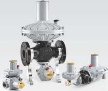
DİREKT ETKİLİ GAZ BASINÇ REGÜLATÖRLERİ