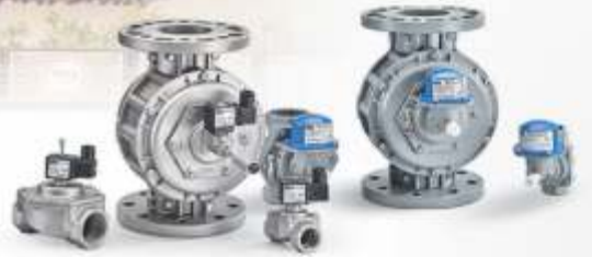
GAZ VALFİ VE DEPREM VANALARI